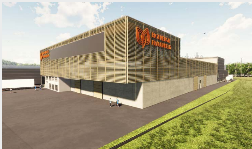
Fig. 1 Visualisierung der Gesamtanlage.

Die Herstellung der hochwertigen Biokohle passiert nebenher und mindert die Strom- und Wärmebereitstellung nicht. Aber sie speichert einen Teil des der Atmosphäre entzogenen Kohlenstoffs. Dadurch entsteht ein rentabler und umweltfreundlicher Kreislauf, denn die Kohle kann positiv verwertet werden: etwa als Futterzusatz oder als Bodendünger. Letztere Nutzung vermindert gar den Einsatz von Düngemitteln. Konventionelle Holzkraftwerke hingegen erzeugen keine Biokohle, sondern Asche – ein Abfallprodukt, das deponiert werden muss.