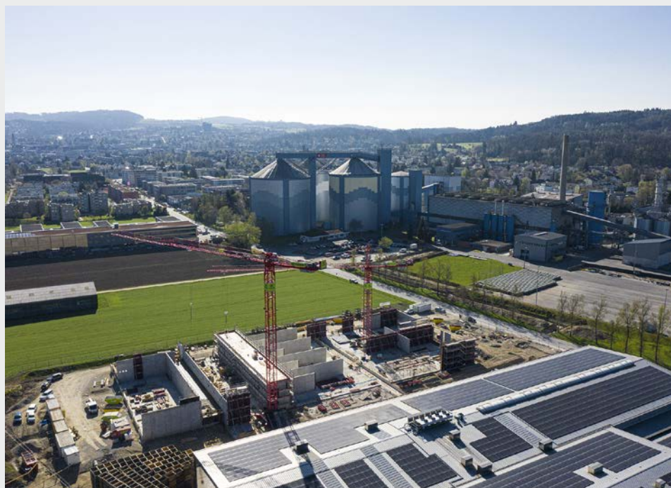
Fig. 4 Luftaufnahme der Baustelle in Frauenfeld.

Der Zeitplan ist äusserst ambitioniert für das Leuchtturmprojekt, dennoch haben sich die Partner im Januar 2020 gemeinsam entschieden, die Detailprojektierung zu starten, mit dem Ziel: Baustart im Dezember 2020 und Abschluss der Inbetriebnahme bis Mitte 2022. Kurz darauf